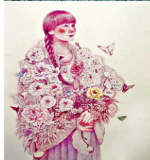
另一幅或許充滿寓意的作品《Floral Stole》。

「瞬間的日記」增田有美個展 即日起至 3 月 1 日 · 中環鴨巴甸街 35 號元創方 A 座 5 樓 S510 室 Art Projects Gallery 網址： www.artprojectsasia.com